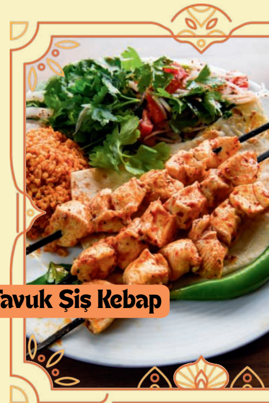
Tavuk Şiş Kebap